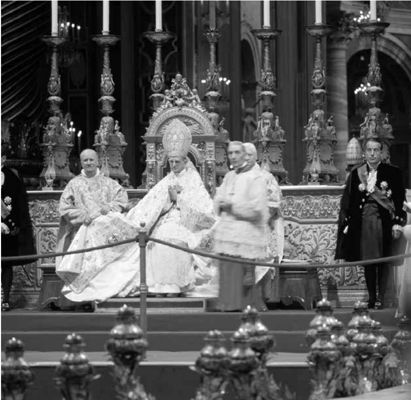
Papst Paul VI. während des Zweiten Vatikanischen Konzils

8. Eine Wende von mehr oder weniger wirkungslosen Ansprüchen zu einer realen Leitungsfunktion haben erst neue Entwicklungen gebracht, die seit dem 8. Jahrhundert eintraten. Hier sind vor allem drei Aspekte wichtig geworden: Als erstes ist die wachsende Entfremdung zur Ostkirche zu nennen; im Gefolge des Bilderstreits wuchsen die Streitigkeiten. Deswegen wandten sich die Bischöfe von Rom jetzt vor allem den Franken, also dem Westen, zu, wo sie bald die Repräsentanten „der“ Kirche wurden. Dies wurde, zweitens, verstärkt durch die Neuorganisation des abendländischen Christentums seitens der sog. Angelsächsischen Mission. Diese war stark – anders als die vorherige, grundlegende iroschottische Mission – romorientiert, weil sich die dortige Kirche auf eine Gründung von Rom aus zurückführte. Vor allem der wichtigste dieser Missionare, Bonifatius (gest. 754), versuchte, die fränkische Kirche an Rom zu binden. Gegen Ende des 8. Jahrhunderts wurde die bisherige muttersprachliche fränkische Liturgie durch den römischen Ritus ersetzt; die westliche Kirche wurde zunehmend eine lateinische Kirche. Diese Tendenzen wurden, drittens, durch die Politik der Karolinger etabliert: Pippin, der Vater Karls des Großen, hatte den letzten Merowingerkönig gestürzt und ließ sich danach von Papst Zacharias im Jahr 751 zum König weihen, um seine fehlende Legitimität sakral zu sichern. Sein Sohn Karl wurde im Jahr 800 vom Papst in Rom zum ersten westlichen („römischen“) Kaiser gekrönt.