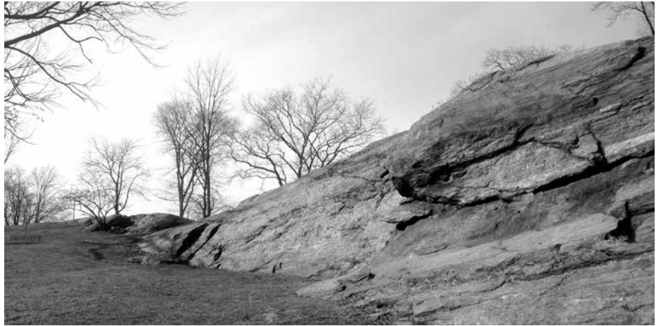
Schiefer bestëmmt déi sougenannte Rued-Roth-Linn (© Joël Adami [Kaart]; CC BY-SA 2.0 Philip Bump via flickr)

Dëst ass een Episod (7.3.2016) vum Blog Angscht a Schrecken . ( https://www.angschtaschrecken.lu/2016/03/07/wou-d-eislek-ufaenkt/ )